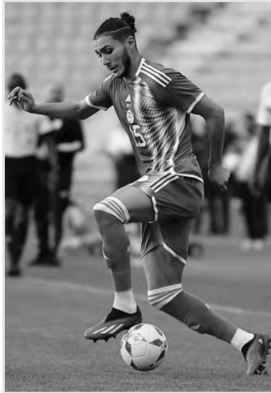
وسبق للاعب صاحب الـ 31 عاما أن شارك في 14 مباراة مع "الخضر" ضمن مختلف المسابقات سجل خلالها هدفا

كشفت مصادر إعلامية جزائرية أن نجم المولدية مرشح بقوة للتواجد ضمن قائمة منتخب الجزائر، تحسبا للمواجهتين أمام غينيا وأوغندا ضمن تصفيات كأس العالم 2016 بشهر جوان المقبل.