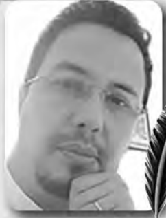
بقلم : حسان زهار

الأحد 31 مارس 2024 الموافق لـ 21 رمضان 1445 هـ